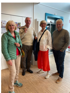
”Eftersnack 2” Fyra nöjda medlemmar