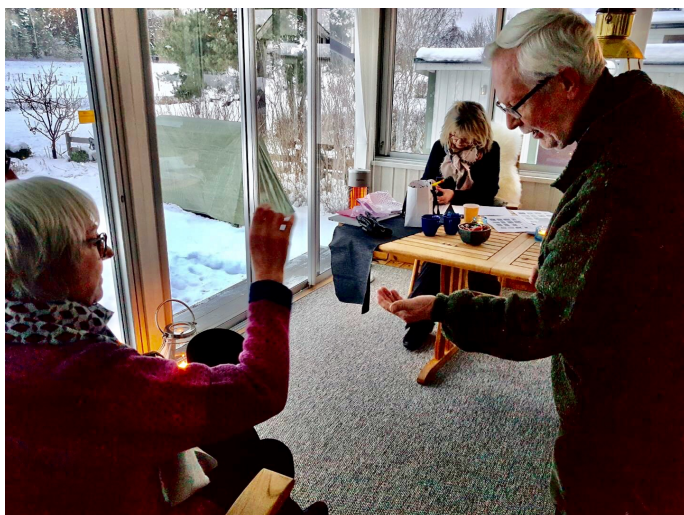
Bilder från vinstlotteriets dragning

Lyckliga vinnare redovisas nedan, och de har all godkänt publicering i sann GDPR –anda.